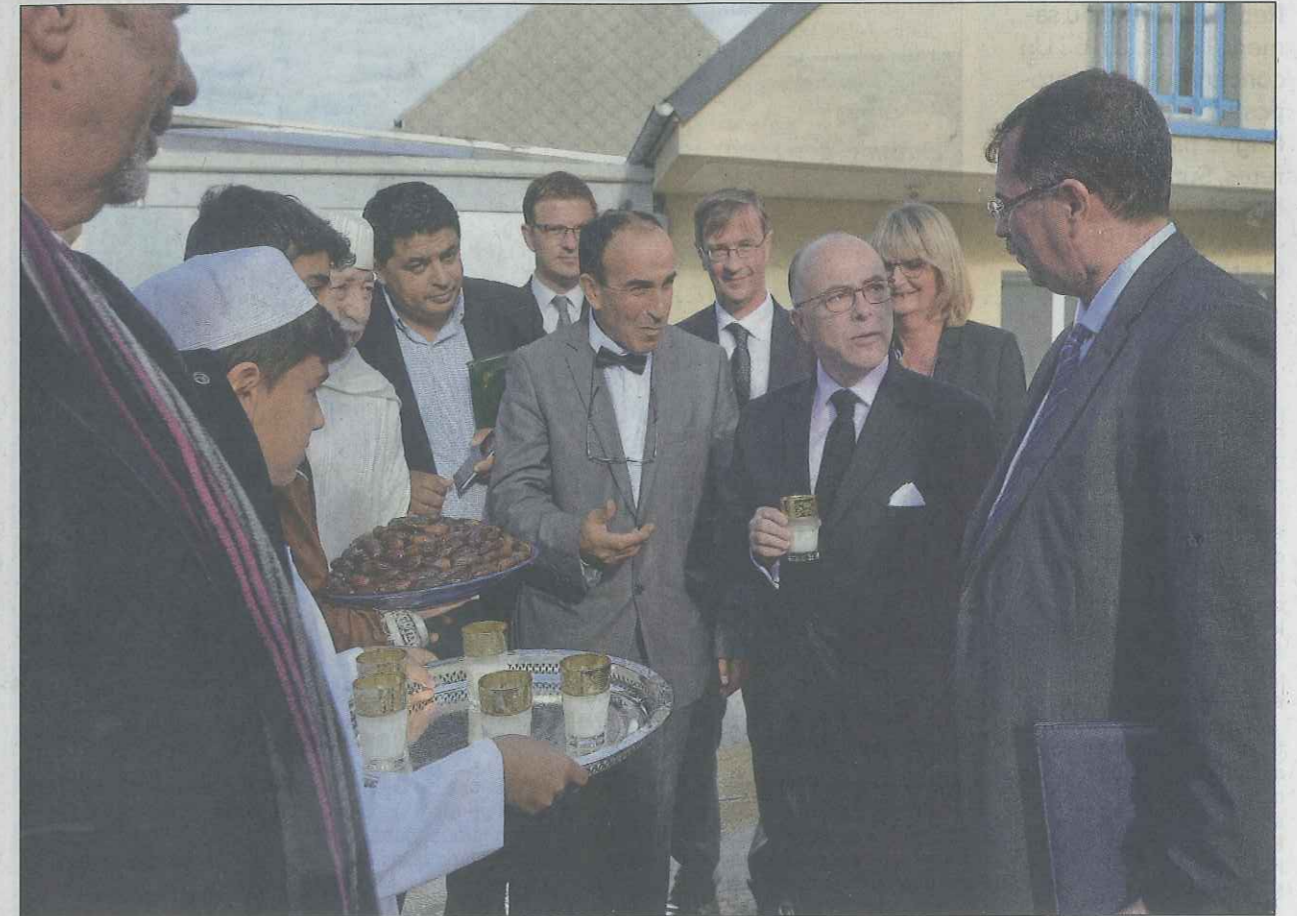
Bernard Cazeneuve a été accueilli hier soir à la mosquée de Cherbourg par les élus locaux, par les responsables locaux de la mosquée mais aussi par le président du Conseil national du culte musulman.

Une promesse qui passe aussi par une défense de la laïcité. « La laïcité, c'est le droit de croire ou de ne pas croire, c'est la garantie de la liberté de conscience, ce n'est pas l'intolérance ou le rejet de l'autre, ce n'est pas l'interdiction des menus de substitution dans les cantines. » « Je ferai en sorte que la liberté de culte soit garantie dans ce pays », a insisté Bernard Cazeneuve, en estimant que notre société a plus