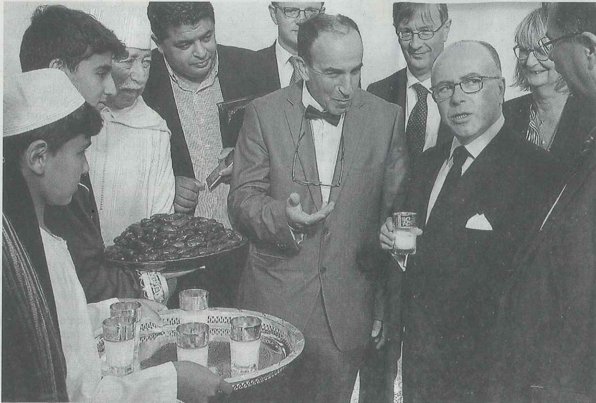
Le ministre de l'Intérieur et des cultes a partagé le thé et les plats de l'Aïd-el-Kébir.