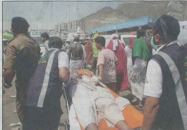
À Mina, près de La Mecque, 717 personnes sont mortes et 863 ont été blessées selon le dernier bilan, lors d'une bousculade hier au pèlerinage de l'Aïd al-Adha.