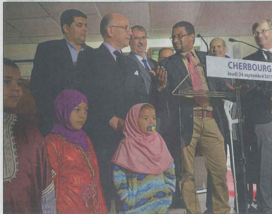
L'imam de Cherbourg a insisté sur « l'attachement profond de la communauté musulmane aux valeurs de la République ».

cadres religieux, Bernard Cazeneuve s'est félicité qu'il existe un consensus pour demander que les imams exerçant en France soient francophones et formés à nos valeurs républicaines et notamment au principe de laïcité », et a donc annoncé qu'une douzaine de formations adaptées seront ouvertes dans des universités françaises, d'ici à la fin de l'année.