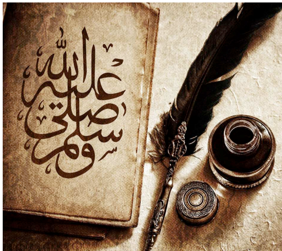
→ Le Coran

«... Allah élèvera en degrés ceux d'entre vous qui auront cru et ceux qui ont reçu le savoir... » Sourate 58, verset 11. «... Parmi Ses serviteurs,