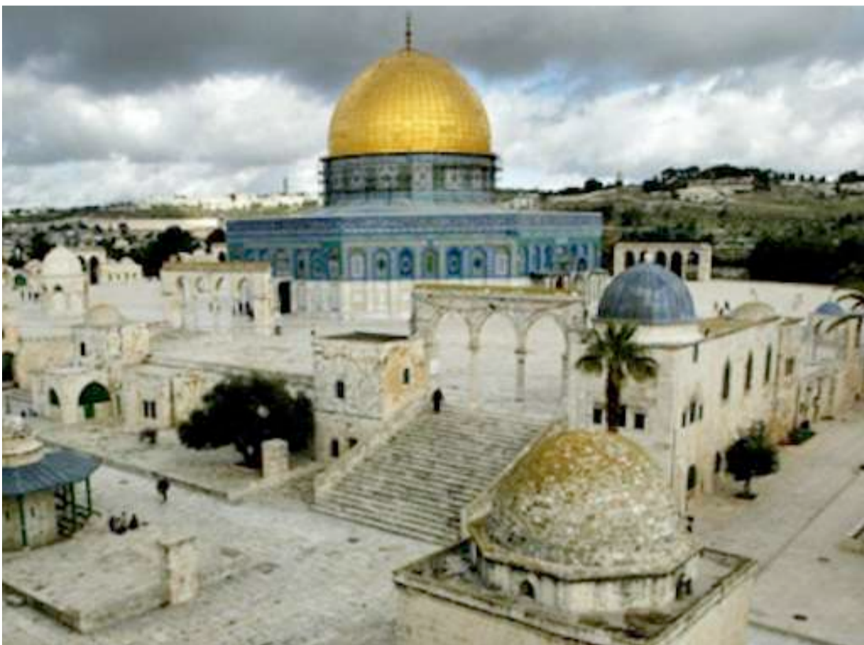
→ Le dôme du Rocher.

L'esplanade des Mosquées se trouve sur une hauteur calcaire qui domine la vieille ville de Jérusalem à 740 mètres. Elle a une forme trapézoïdale